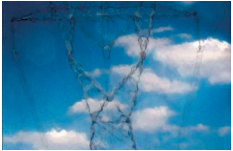
► 'Pas als je de druk laat zakken, kun je spelen, dromen en creatief zijn', weet Peter. 'Je ziet ook geen obstakels meer.'

Daan: "Dat is net het mooie: de plaatselijke bevolking heeft nooit de neiging om te zeggen: 'Zijn jullie ons nu aan het uitlachen?' Neen, want zij zijn zich heel goed bewust van de natuurlijke schoonheid van hun landschappen. Alleen de rest van de wereld en de Lonely Planet hebben die schoonheid nog niet ontdekt."