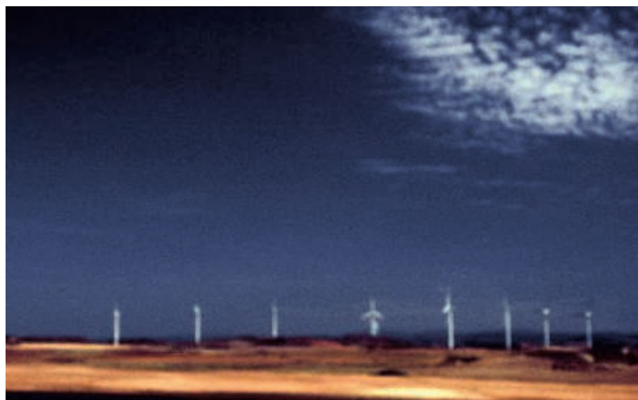
► 'Ik wist dat ik hier moest zijn', zegt fotograaf Peter De Bruyne. 'Lonely Planet kent het niet eens.'